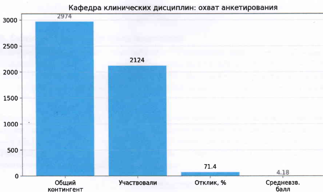
Рисунок 1. Охват анкетирования и сводные показатели кафедры клинических дисциплин.